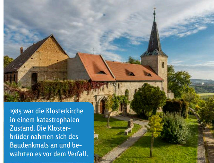
1985 war die Klosterkirche in einem katastrophalen Zustand. Die Klosterbrüder nahmen sich des Baudenkmal an und bewahrten es vor dem Verfall.