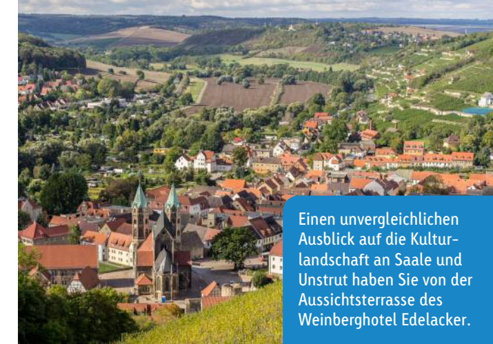
Einen unvergleichlichen Ausblick auf die Kulturlandschaft an Saale und Unstrut haben Sie von der Aussichtsterrasse des Weinberghotel Edelacker.