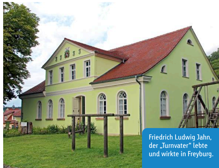
Friedrich Ludwig Jahn, der „Turnvater“ lebte und wirkte in Freyburg.

RESERVIERUNG Freyburger Fremdenverkehrsverein e.V. Markt 2 • 06632 Freyburg (Unstrut) Tel.: 034464 27 260 • Fax: 034464 27 376 E-Mail: kontakt@freyburg.info